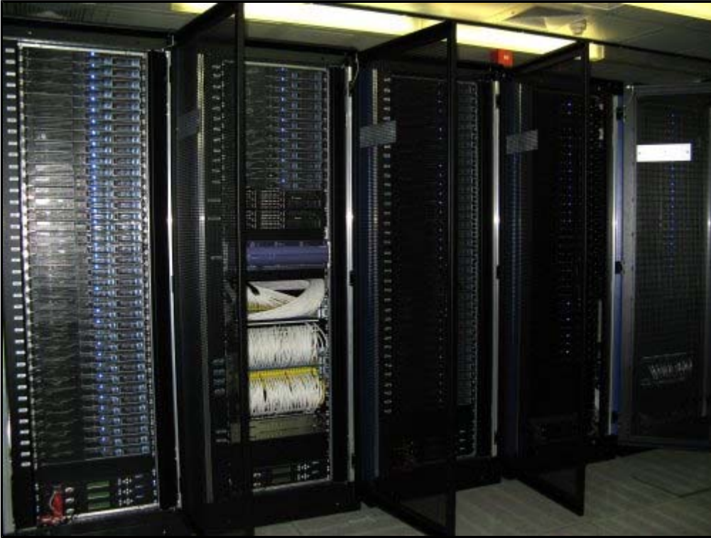
Vorderansicht (schräg links)