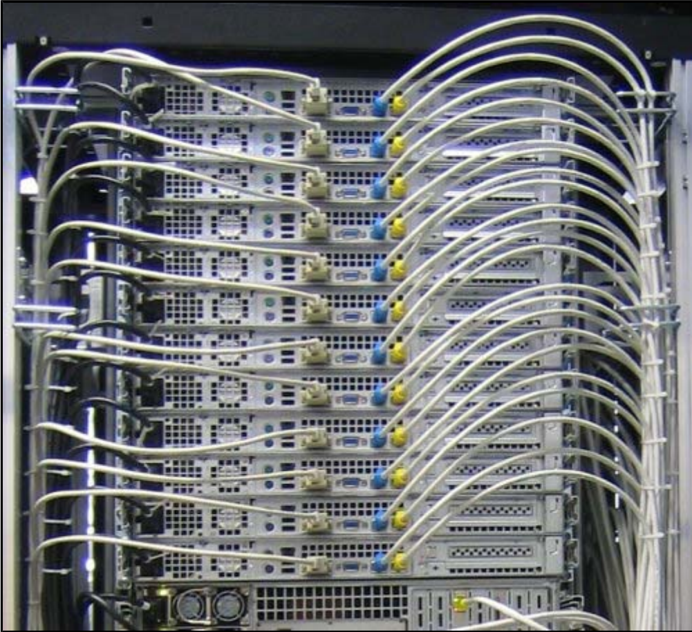
Rückansicht Linux-Cluster (einer der Schränke)

Auf dem obigen Foto von der Rückseite einiger Compute Nodes ist rechts die Zuführung der GigaBit-Ethernet-Kabel zu sehen. Der graue Kabelbaum auf der linken Seite umfasst die serielle Konsolen-Verkabelung. Über dieses serielle Netzwerk kann zu Wartungszwecken auf die Compute Nodes zugegriffen werden. Die Stromzuführungen zu den einzelnen Compute Nodes (schwarze Kabel auf der linken Seite) sind einzeln schaltbar.