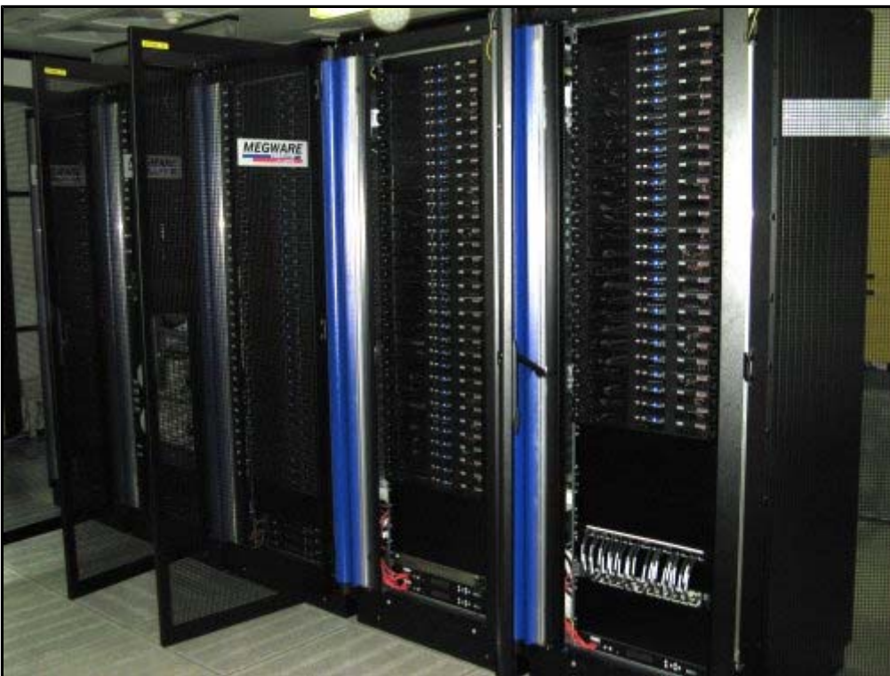
Vorderansicht (schräg rechts)

Das Foto zeigt den entsprechenden Aufbau. Die 2.0 GHz Compute Nodes mit 16 GByte Hauptspeicher befinden sich über den Frontend Nodes.