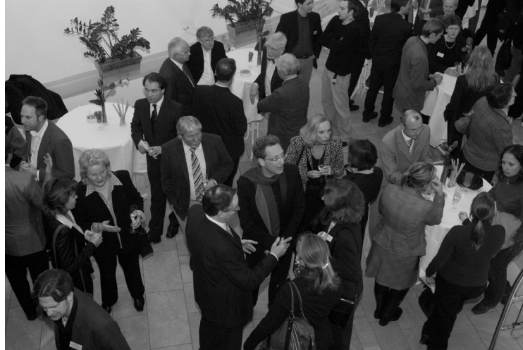
Empfang nach der Preisverleihung