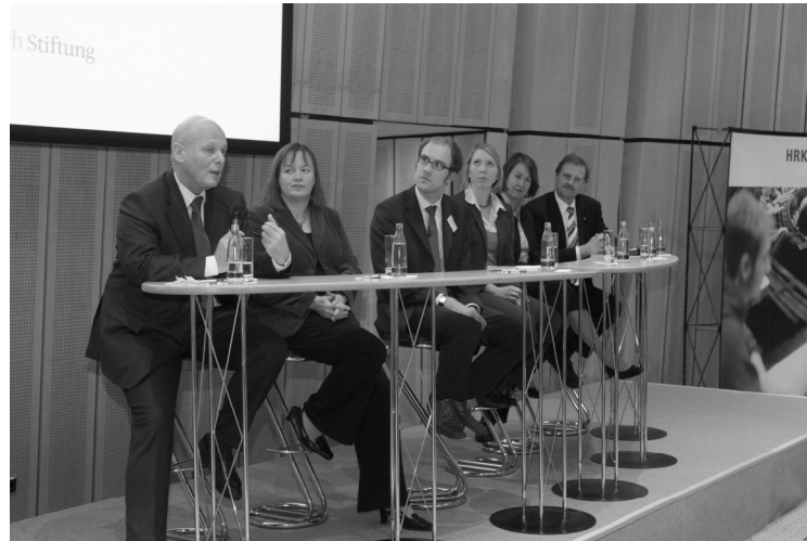
Diskussionsrunde nach der Verleihung